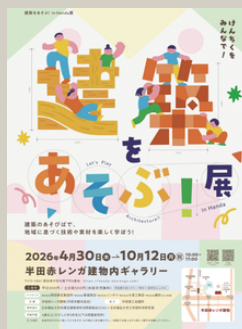
イベントのチラシ

イベントは10月12日まで開催中ですので、気になる方はぜひ赤レンガ建物で体感してみてください!