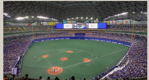
盛り上がるバンテリンドーム